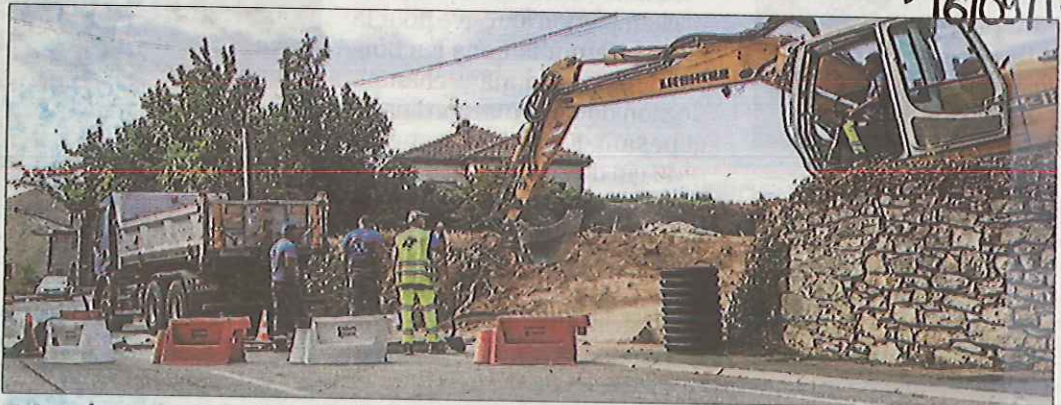
■ Avec les travaux sur la route de Barjac, la circulation est en mode alternée.

La route de Barjac non loin de l'entrée du domaine Clavel est en travaux. L'entreprise de BTP Robert de Verfeuil intervient pour faire passer les canalisations du tout à l'égout et des eaux du futur lotissement qui est en train de sortir de terre chemin du Mijoulan. La route de Barjac est en conséquence placée en circulation alternée. Ces travaux devraient être terminés avant dans les jours à venir.