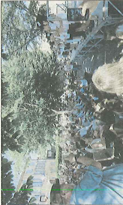
■ Les enfants sous les feux de la rampe.

Sous le regard ému de parents tenant à bout de bras appareils photos et autres smartphones diffusant pour certain la prestation en direct sur les réseaux