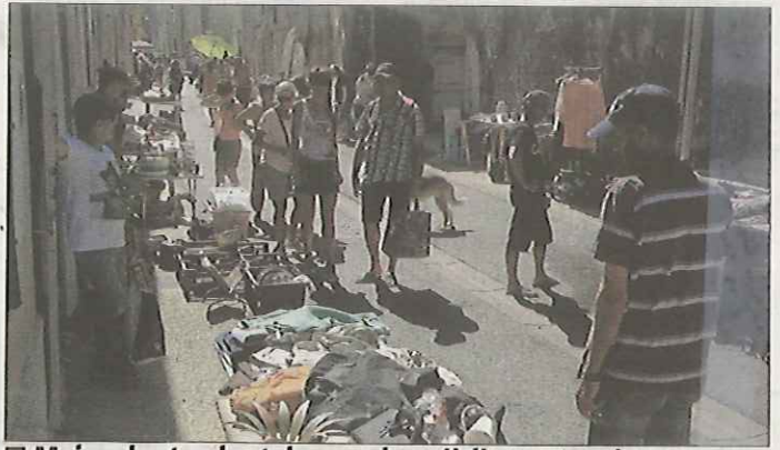
■ Moins de stands et de monde qu'à l'accoutumée.

Parmi les propositions, un changement de lieu ou une version nocturne ont été évoquées.