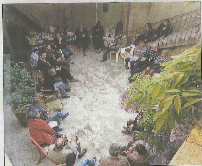
■ Le public au rendez vous chez l'habitant.